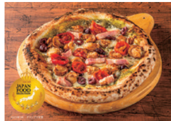
「噴火湾産ベビーホタテとホエー豚ベーコンのバジルピザ」